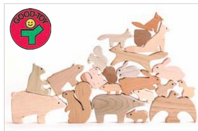
【森のどうぶつみぎ】 5種類の木(サクラ、ホオ、クリ、シラカバ、ナラ)の異なる表情が特徴的で、贈答品としても人気が高い。

飛騨高山を拠点に、お椀などの小物から家具、建築にいたるまで、日本に伝わる木の文化を現代に再現。自然との共生をモットーにモノ造りに取り組む。