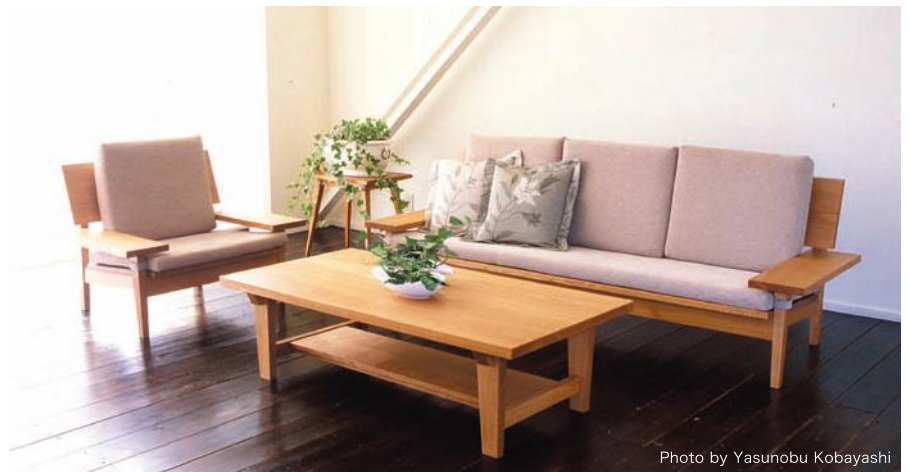
【フューチャーホライズンソファセット】 人気が高い家具のオーダーメイドは、親子代々で使ってもらえるようデザインや使い勝手にも配慮。