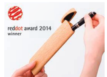
【TANTO:】 短刀をモチーフにした、流線型のデザインが美しい木製ペンケース。