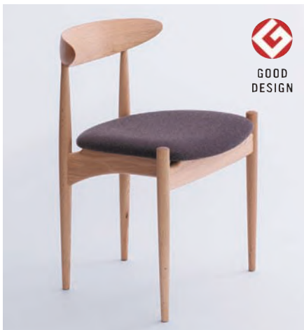
【スワローチェア】 日本人の体型に合った設計にこだわり、快適な座り心地を追求。