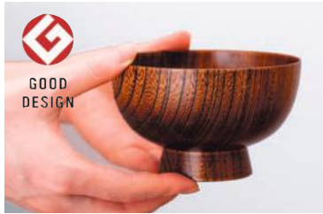
木目を生かした拭き漆塗仕上げのお椀は、長く使うために修理や漆の塗り直しも推奨している。

国産無垢材で造られる家具や小物、建築物は多少値段がはるかもしれない。しかし、素材や工法にこだわり、購入者が大事に扱うことで、家族代々で愛される逸品となる。この魅力を国内だけでなく、海外にも伝えられるような環境作りも同社の次のビジョンだ。まだまだ課題は多いものの、和食のように、日本の木の文化が世界遺産に登録されることを目指し、木が秘めている可能性や素晴らしさを広めていきたいという。