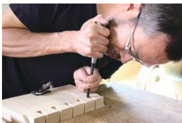
無垢材の強度を活かすために、飛騨の匠の伝統技術が光る。

他の大手家具メーカーが安価な北米の木材を輸入する一方、同社は日本の国土の約7割を占める森林の資源を有効活用することで、林業の活性化や循環型社会の実現を目指している。さらに、十数年で腐食する金属などを使わない工法で経年劣化を防止。手に取った人が長く愛着を持てるものを作る姿勢も同社のこだわりだ。創業当初は家具や小物が中心だったが、購入者から店舗の内装についても相談を受けたことがきっかけで、30年程前から本格的に木造建築にも取り組んでいる。